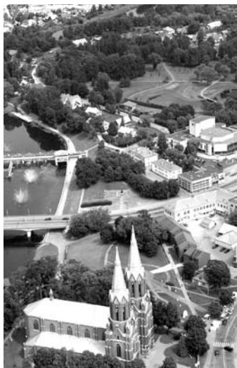
Darnus planavimas leis išnaudoti urbanizuotų teritorijų galimybes ir saugos gamtą.

Viena iš prioritetinių krypčių Europoje yra darnus miesto vystymasis. Nuo 2014 metų įsigaliojęs teritorijų planavimo įstatymas leidžia gyventojams sutaupyti laiko ir pinigų, nerengiant bendrųjų planų. Naudą iš šio įstatymo patirs ir savivaldybės, ir gyventojai, kuriems sutrumpės dokumentų rengimo laikas statyboms, sumažės pačių dokumentų, ir gamta.